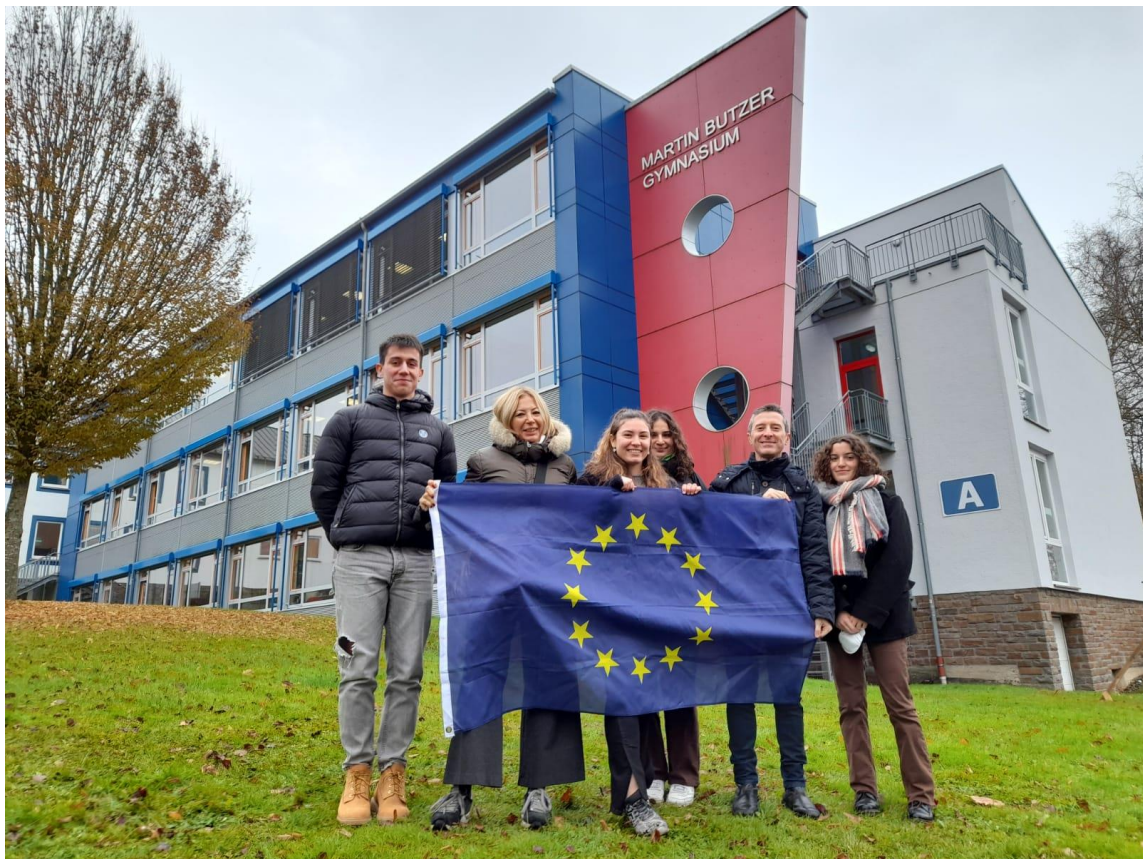
Mobilità a Dierdorf per 4 studenti accompagnati da 2 docenti