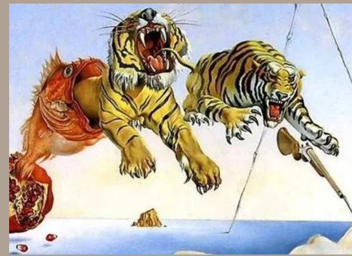
Sueño causado por el vuelo de una abeja alrededor de una granada un momento antes de despertar