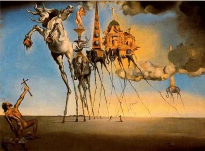
Tentaciones de san Antonio