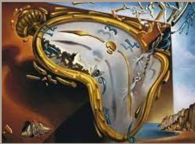
Los relojes suaves