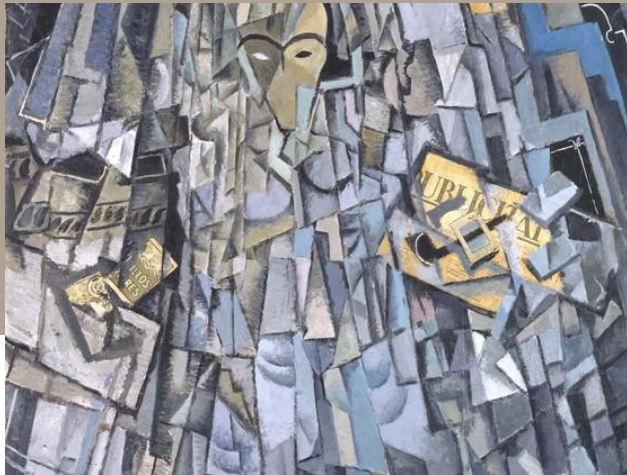
Autorretrato (con técnica cubista)

pero también usaba técnicas de cubismo y dadismo